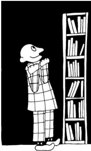
Meneer Boek verlekkert bij de boekenkast met heel veel boeken.

“Een feest vieren maakt de wereld een beetje leuker.” Dit citaat is van Meneer Boek en staat in het vandaag verschenen prentenboek, genaamd Meneer Boek , geschreven en getekend door Clémence Leijten en Joris Leijten en uitgegeven door Joleijt educatieve producten. Het boek is geschreven voor kinderen vanaf 6 jaar en hun ouders. Meneer Boek is een nieuwsgierige man die altijd in boeken van de bibliotheek zoekt naar (schatten van) verhalen. Door een dagelijks voorval denkt Meneer Boek aan een bepaald feest, bijvoorbeeld het Sint-Maartensfeest. Hij vraagt zich verwonderd af: “Wat is dat dan, dit Sint Maartensfeest ?” Meneer Boek gaat vervolgens op zoek naar een antwoord, een antwoord soms oer-, oer-oud. Tot slot viert hij het feest met mensen in zijn omgeving. In het bijbehorende lesboek Het verhaal van Meneer Boek gaan de auteurs dieper op de feesten in. Het prentenboek en het lesboek zijn (apart of samen) te koop bij de webwinkel van Joleijt.